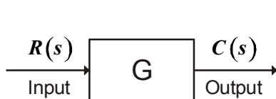
(a) Open loop